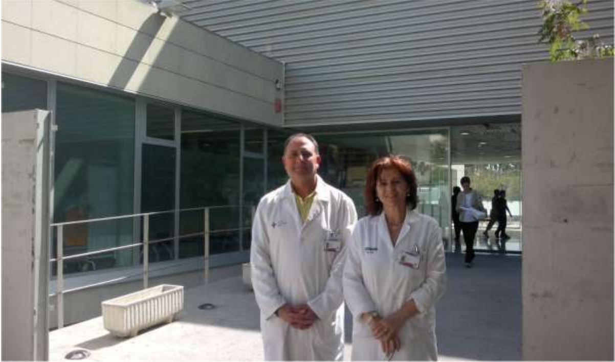
Imagen de los ponentes en las puertas de su lugar de trabajo.

Atentamente, Grupo de Docencia e Investigación de SCELE.