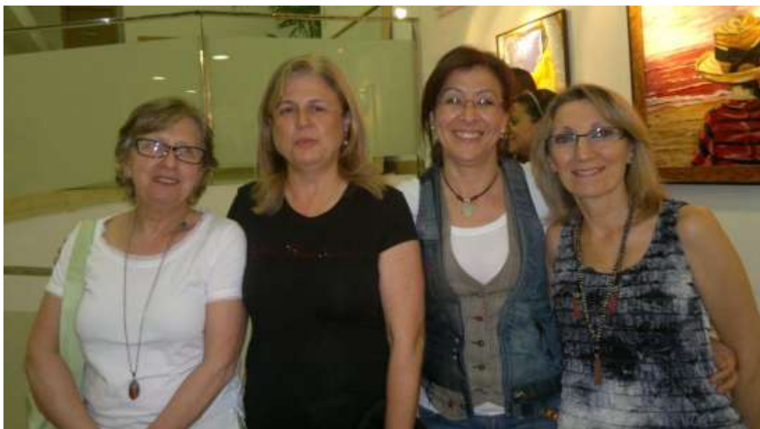
Momentos del descanso.